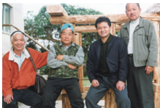
旧歴史民俗資料館 義館長による高倉建築(左から2番目)