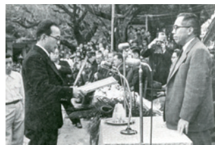
日本復帰協議会議長 泉芳朗氏から鹿児島県知事への感謝状贈呈