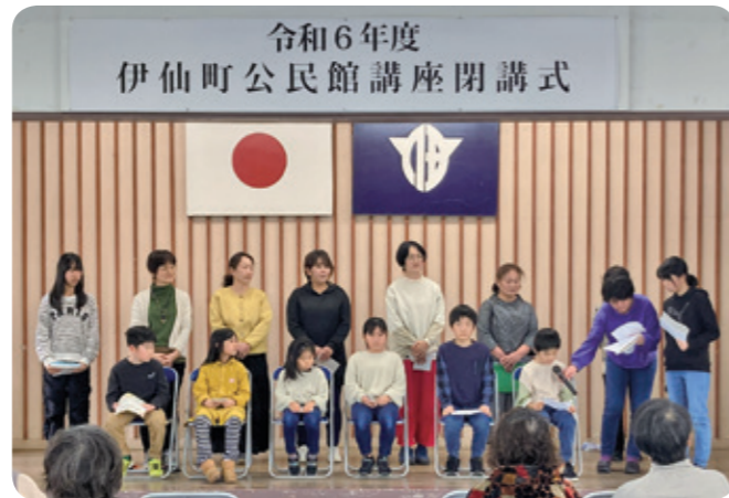
■講座閉講式のようす