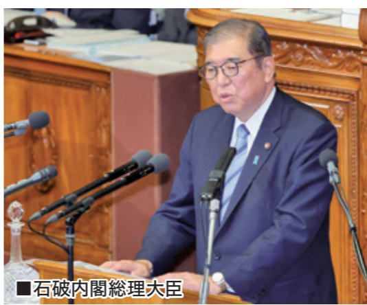
■石破内閣総理大臣