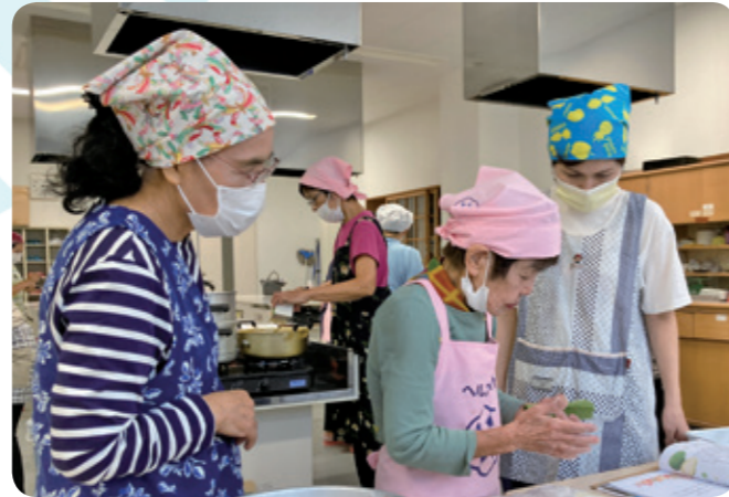
■郷土料理教室のようす