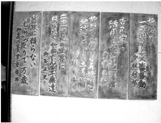
集落の核拠点である公民館の玄関先には、自立に向けた標語が飾られていました。(鹿屋市串良町上小原柳谷集落公民館前)