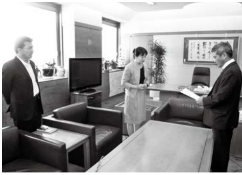
県議会議長あてに要望書提出 (鹿児島県議会議長室)