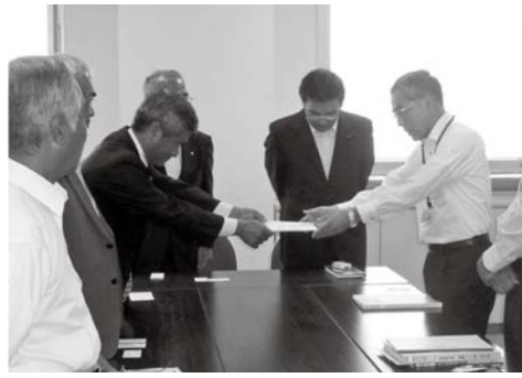
県知事あてに要望書を提出 (鹿児島県土木課会議室)