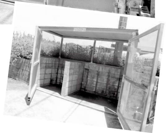
▲収集場所の美化にも配慮した町内某集落のゴミステーション。