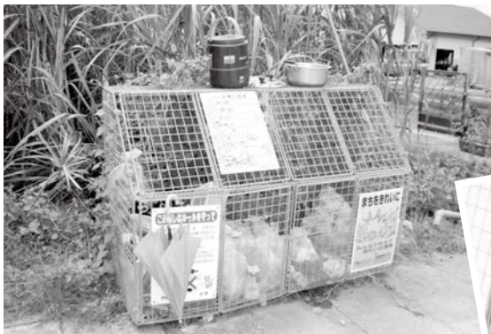
▲燃えるゴミの日にも関わらず、あらゆるルール違反が多い某集落ゴミステーション。このような違反箇所については、集落民全員で対応する必要があります。