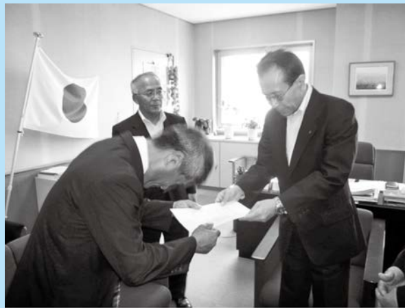
平成24年4月に就任された、六反省一鹿児島県新教育長へ要望書を提出。