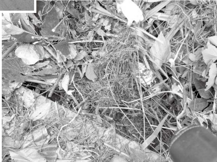
○水路にゴミが詰まって水が農地に流れ出している状況