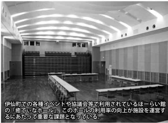
伊仙町での各種イベントや協議会等で利用されているほーらい館の「癒ていなホール」。このホールの利用率の向上が施設を運営するにあたって重要な課題となっている。

なくて、利用できるものは ほとんど利用して活性化し、 住みよい町にしていただき たいと思いますが、見解は。