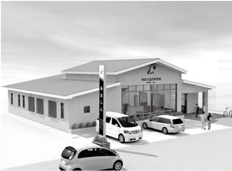
伊仙町中央商店街に、企業誘致の成果として新たにオープンすることとなった奄美大島信用金庫伊仙支店。町内の経済活性化の起爆剤になることが期待される。