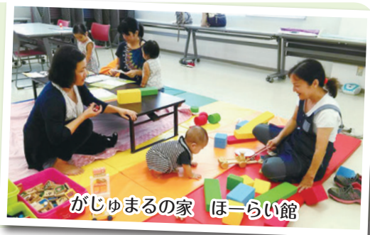
がじゅまるの家 ほーらい館