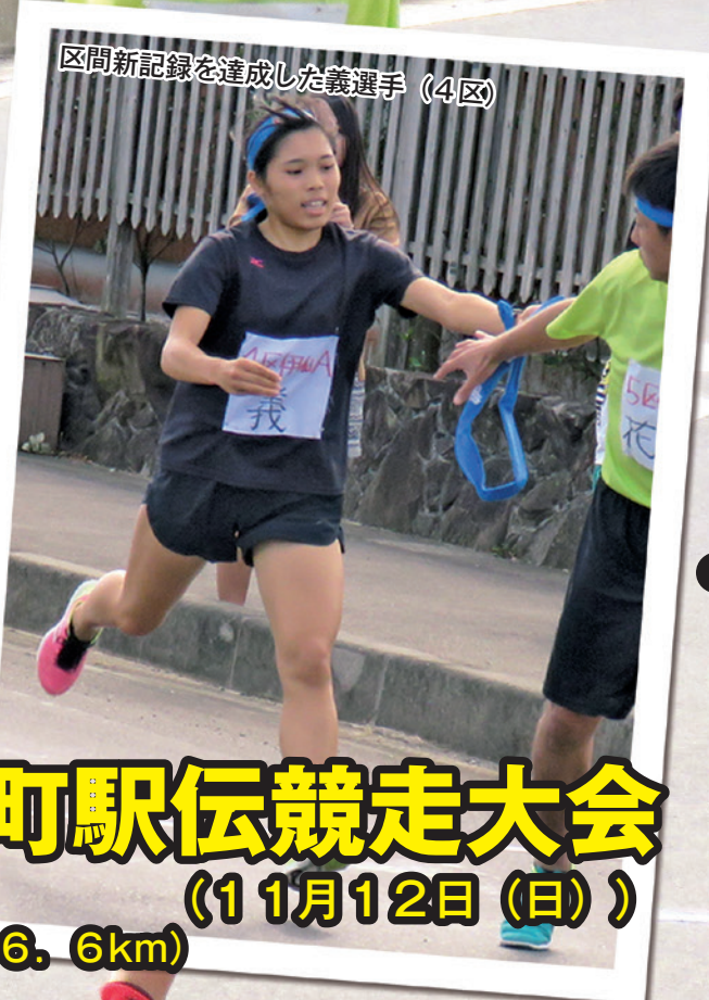
区間新記録を達成した義選手 (4区)