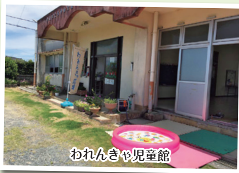
われんきゃ児童館

伊仙町で現在実施している事業については、地方創生予算を活用しており、今後も継続していきたいと考えていますので、引き続きご支援をお願いしたいと思います。また、町の施設使用料をもう少し安くして頂くと、もっと伊仙町での活動の幅が広がって子育て支援のサポートができると思いますので前向きにご検討をお願い致します。