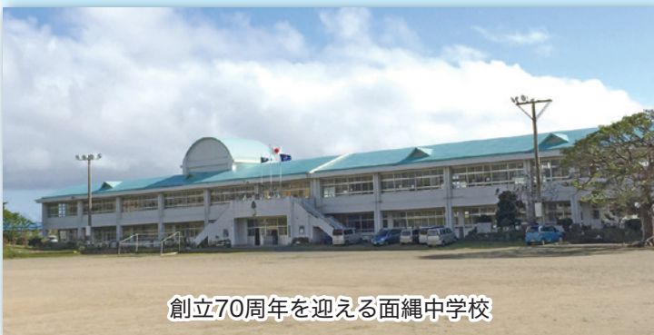
創立70周年を迎える面縄中学校

今後、設置された場合には、卒業生のそういった思いやりの心を子どもたちへ様々な機会を通して教えていききたいと考えております。