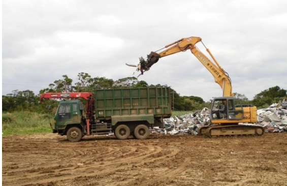
2カ所目の仮置き場での重機で搬出作業の様子