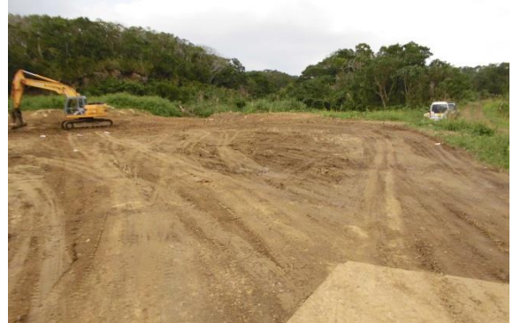
2カ所目の仮置き場での搬出完了後の様子