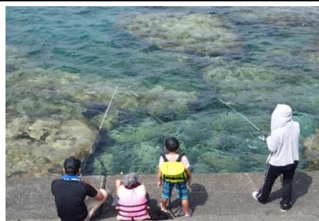
第2回「魚釣り大会」の様子