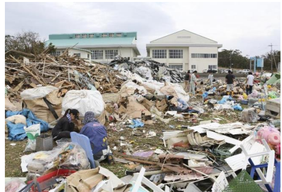
1カ所目の仮置き場での仕分け作業の様子2