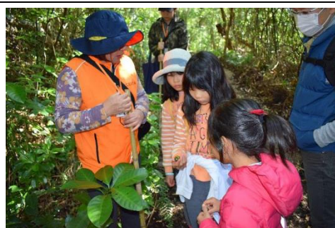
第11回「野草観察会」の様子