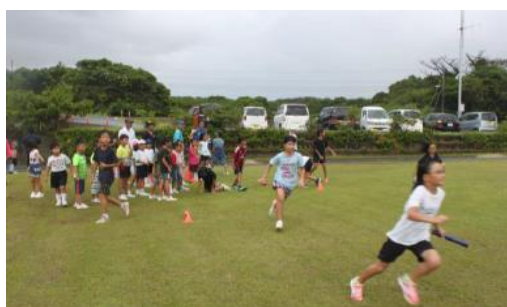
第6回「かけっこ塾」の様子