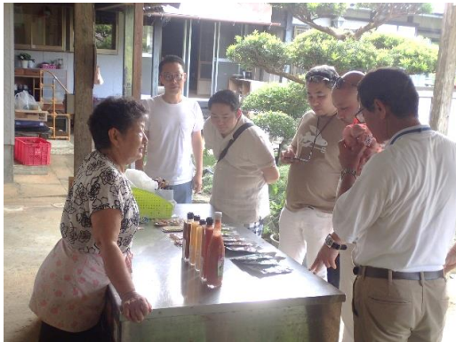
果樹園の加工品視察の様子↑

焼酎 酒造場 (伊仙) 松永酒造 マンゴー ほ場 (伊仙) グアバ・にんにく 果樹園 (伊仙) コーヒー ほ場 (伊仙) 島料理 畦 食堂 (徳之島町山) シークニン 食品工場 (徳之島町轟) ダイキチ園芸食品