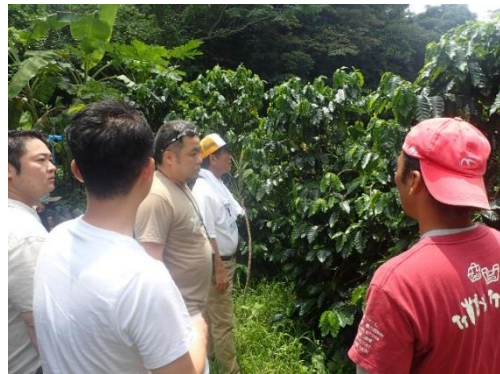
コーヒーほ場視察の様子↑