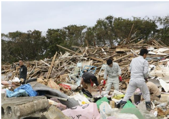
1カ所目の仮置き場での仕分け作業の様子1