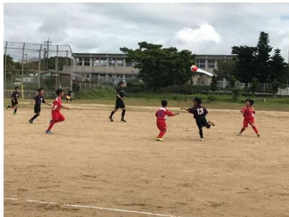
【第44回伊仙町スポーツ少年団競技別交歓大会の様子】

各大会開催運営及び島外大会出場派遣費へ補助金を活用し、各スポーツ少年団へのより良いスポーツ環境づくりに取り組みました。