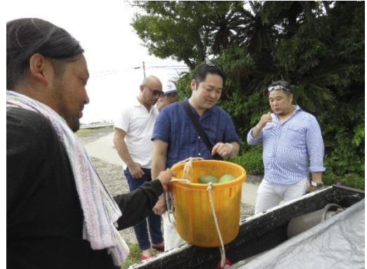
パイヤほ場視察の様子↑

ましゅ屋 工場 (犬田布) パイヤ ほ場 (阿権) ごま・生姜 ほ場 (阿権) ドラゴンフルーツ ほ場 (阿権) 長命草 自生地 (犬田布岬)