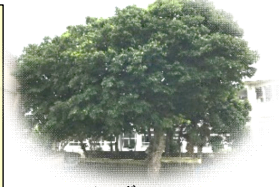
シンボルツリー リュウキュウエキ