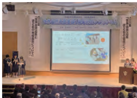
■伊仙中学校による学習発表