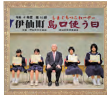
タイトル 『島口つこわーデー』 投稿者：中央公民館

下記、二次元コードを読み取り、必要事項をご記入のうえ、写真データを添付してご応募ください。