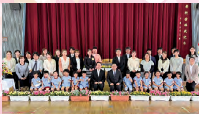
伊仙小学校附属幼稚園