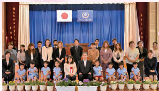
面縄小学校附属幼稚園