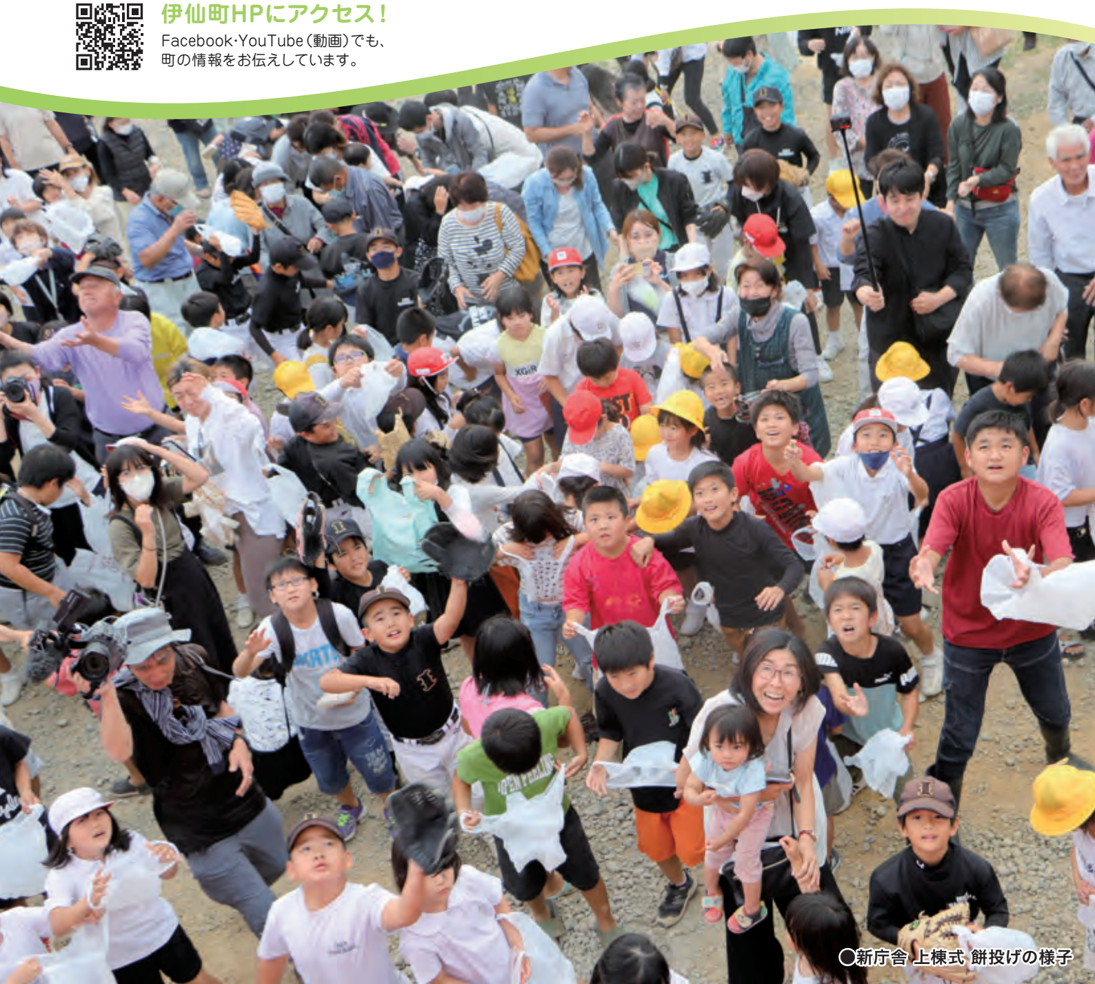
○新庁舎 上棟式 餅投げの様子