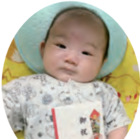
ふくなが りく 福永 凌久くん