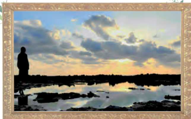
タイトル 『帰路の景色』 投稿者:Tさん(犬田布)

誕生日やイベントなどの記念写真、 面白風景やハプニング写真、お気に入りの 写真などジャンルは問いません。