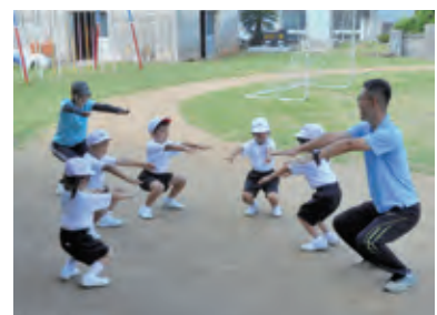
■予防体操にも取り組みます!!