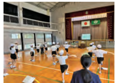
■ロコモチェックの様子

伊仙町では、今年度から年間を通して、小学校8校、中学校3校の計11校で子どもロコモチェックや予防の体操を行います。