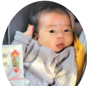
ふとり すい 太 沙維ちゃん