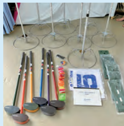
■グラウンドゴルフセット