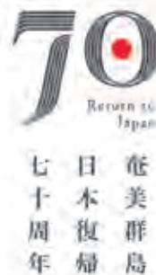
■パターン① (たて書き)

奄美広域事務組合 奄美振興課 電話: 0997-52-6032 (直通) FAX: 0997-52-9618