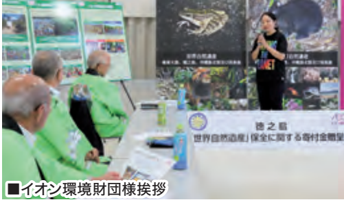
■イオン環境財団様挨拶

今回いただいたご寄付は世界自然遺産保全のため、アマミノクロウサギのロードキル防止対策や普及啓発等に活用させていただきます。