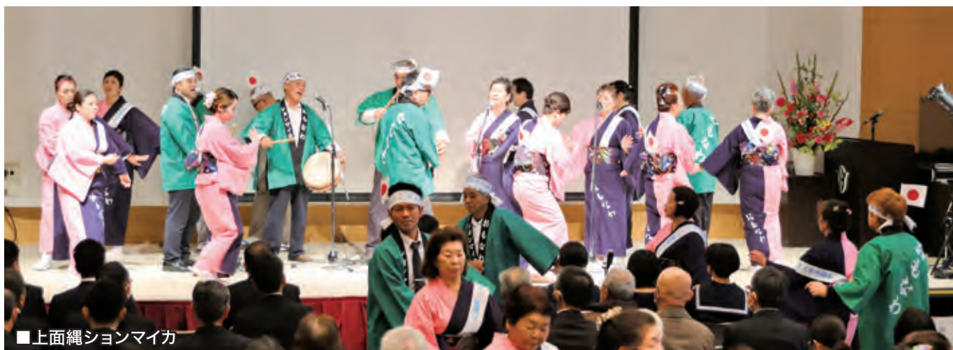
■上面縄シヨンマイカ