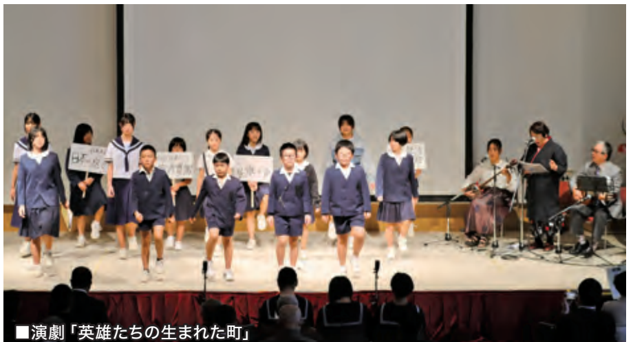
■演劇「英雄たちの生まれた町」