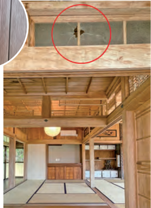
●屋敷内に残る銃弾の跡

前号にて完成をお知らせいたしました阿権集落の前里屋敷は、戦時中の機銃掃射による銃弾の跡や歴史を感じさせる梁（はり）や柱など、築90年以上の古民家の古き良き風情を残し改修されました。