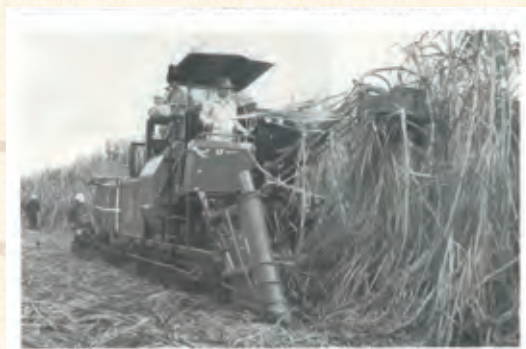
ほ場で稼働中の小型ハーベスター

頼もしい助っ人 小型ハーベスター 今期の製糖よりいよいよ小型ハーベスターが稼働をはじめました。農家の高齢化が進み、後継者不足が心配される現状、さとうもろこし生産農家にとっては収穫作業の省力化が一番の悩みのタネでした。 頼もしい助っ人となるべく登場したのがこの小型ハーベスターです。徳之島農協が事業主体となり、低コストでの導入が実現。導入した小笠原町では、農協が窓口となり、まだ約20台、0.00円で受託作業を行っています。 来年秋からも、毎年一台ずつ導入予定であり、農家から高い関心が寄せられています。