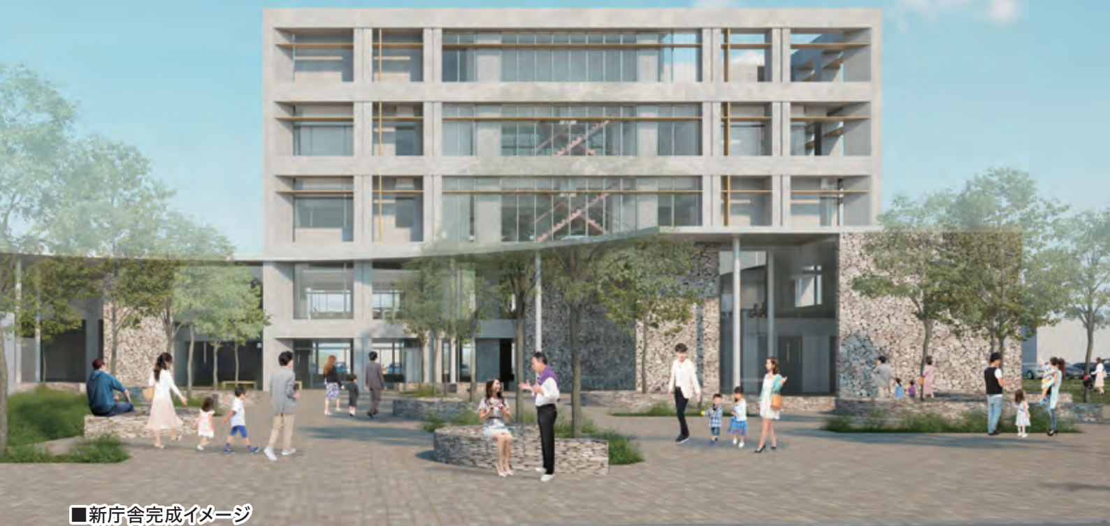
■新庁舎完成イメージ