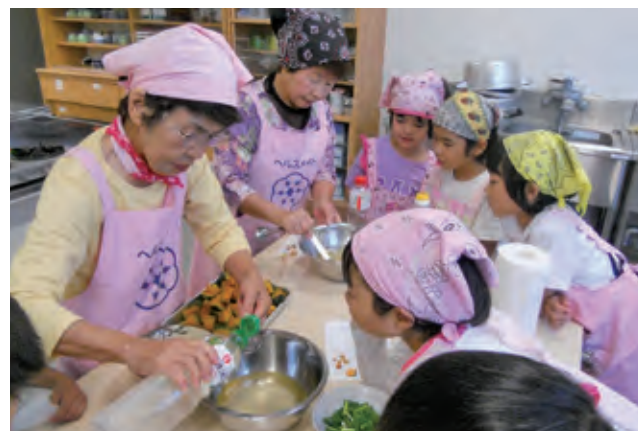
●学童にて調理実習風景