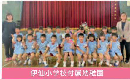
伊仙小学校附属幼稚園