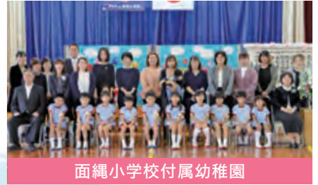
面縄小学校附属幼稚園