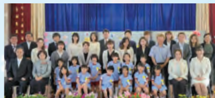
面縄小学校附属幼稚園