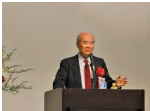
● 第8代ユネスコ事務局長 松浦氏講演の様子

今回は41年前の昭和56年4月号より、少し緊張した3人の新1年生の様子が掲載された、阿権小学校入学式の記事をご紹介します。