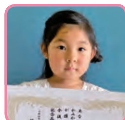
ひろ きこ 廣 輝子 キャサリン ちゃん