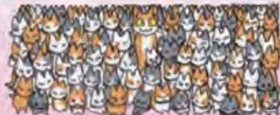
「捨てず増やさず飼うなら一生」環境省パンフレットより