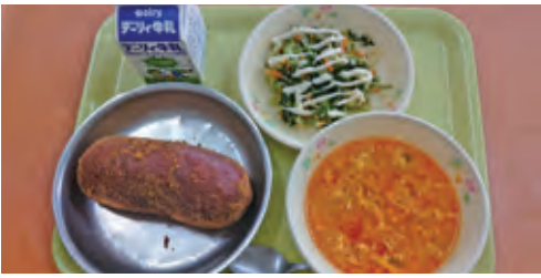
●「TT兄弟スープ」の具材はたまごやトマト等「T」が頭文字の食材がたくさん。

また、受賞した献立を提案した児童・生徒には11月23日に開催された産業祭・食の文化祭で賞状等が授与されました。