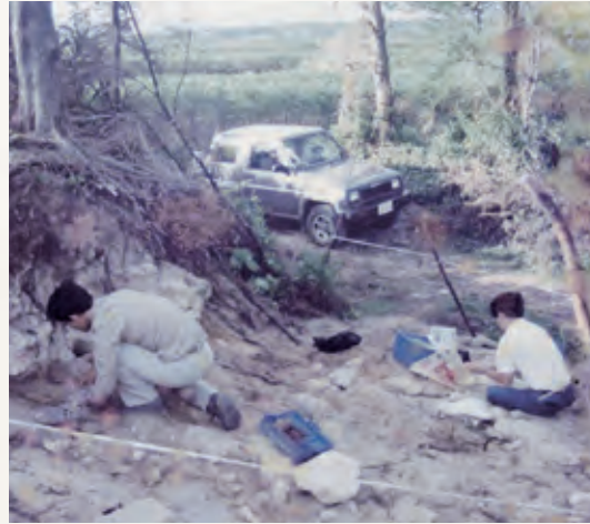
●平成 4 年 調査の様子

佐弁トマチン遺跡は、伊仙町の東側に形成される海岸部標高15mほどの砂丘上にあります。砂丘は佐弁集落の共有地となっており、一昔前ま