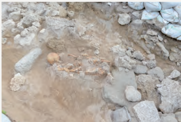
●新しく発見された人骨(中央)と石棺墓(右下)

晩期末く弥生時代前期(今から2,900〜2,800年前ごろ)相当期の土器や貝製品、ヒスイ等が見つかっています。ヒスイは新潟県糸魚川産であることが判明し、この時期には遠くの地域との交流があったことが窺えます。 もう一つの石棺墓の内部は調査されなかったため、現在も砂丘の中に被葬者が埋蔵されている可能性があります。 現在は、発見された地名をとって「佐弁トマチン遺跡」と遺跡名が変更され、調査・研究がなされています。