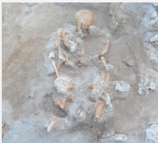
●新しく発見された人骨の様子

伊仙町教育委員会は、平成28年度、平成30年度、令和元年度に佐弁トマチン遺跡の墓域の広がりや内容を確認するために発掘調査を行いました。その結果、鹿児島大学埋蔵文化財調査センターが調査したお墓よりも東側の砂丘中から埋葬人骨を発見しました。人骨は大腿骨(太ももの骨)の途中から足先が消失していました。埋葬された人骨は壮年男性であることがわかりました。人骨には石棺墓が構築されていたと考えられますが、発見時は2個の石灰岩が残っているだけの状態でした。