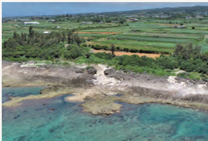
●海上から佐弁トマチン遺跡を臨む(中央部)

晩期末く弥生時代前期(今から2,900〜2,800年前ごろ)相当期の土器や貝製品、ヒスイ等が見つかっています。ヒスイは新潟県糸魚川産であることが判明し、この時期には遠くの地域との交流があったことが窺えます。 もう一つの石棺墓の内部は調査されなかったため、現在も砂丘の中に被葬者が埋蔵されている可能性があります。 現在は、発見された地名をとって「佐弁トマチン遺跡」と遺跡名が変更され、調査・研究がなされています。