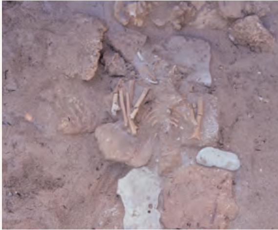
●平成 4 年 発見された人骨とお墓の様子