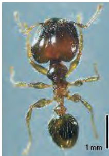
(動物：1種) ・ツヤオオズアリ

県では、条例に基づいて、県内各地に本来生息・生育する動植物に影響を与え、本県の自然環境や農林業等へ被害を与える恐れのある動植物を「指定外来動植物」として指定し、その取り扱いを規制しています。 今年度は、左記の2種類を指定し、令和4年2月1日から取り扱いが規制されます。