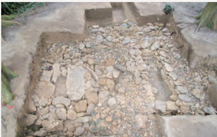
●鹿児島大学が調査した 2 基の石棺墓の様子

ばれていました。その後、平成16～20年度にかけて、鹿児島大学埋蔵文化財調査センターによって発掘調査が行われました。調査の結果、石灰岩で組まれたお墓（石棺墓）2基と砂を掘ったお墓（土壙墓）1基が見つかりました。石棺墓の1つは3段構造になっており、合計4個体分の人骨が埋葬されていました。人骨を科学分析に出した結果、約2,400～2,100年前のものであることが明らかになりました。お墓の中からは、縄文時代