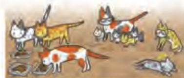
「もっと飼いたい？」環境省パンフレットより