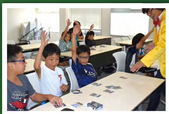
第2回 「カードゲームで遊びながら学ぼう」