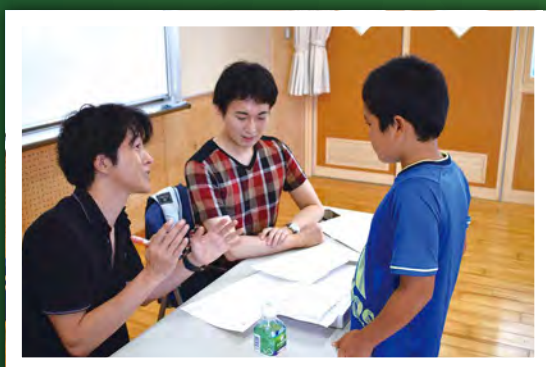
第1回 「読書感想文の書き方のコツ」

3年目を迎えた寺子屋は、離島では直接話を聴く機会のないあらゆる分野のプロフェッショナルな講師を島内外から招き、子どもから大人まで誰もが一緒に参加できる体験型ワークショップを行いました。講師からは、参加者の中でもこれから大人へと成長する子ども達に対して、「疑問に感じたことは自分で考え解決できる力をつけること。そのためにはたくさんの経験や体験をすること」「いろんなことに挑戦し、新しい自分を発見すること」などを伝えてくれました。全講義を振り返り、町内だけでなく町外からも多くの参加があり、熱心にそして楽しみながらワークショップを受講している様子を感じました。参加してくれた皆様、ありがとうございました。