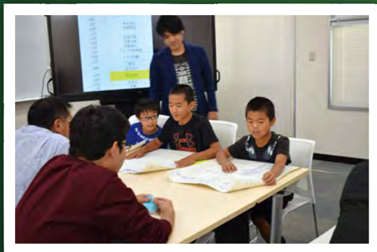
第6回 「好きなことを仕事にするって?」