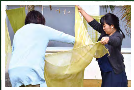
第9回 「サトウキビで染物を作ろう」