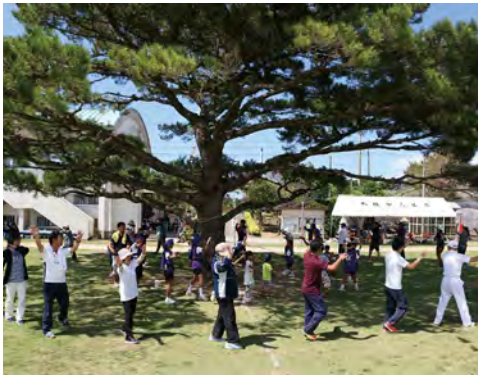
小規模校区の存続が集落の活力を生み出す

現存する公民館、保育園、小学校、中学校を統合することなく、これらの拠点を核にした集落単位の活性化を明確に打ち出します。特に小規模校の存続に関しては、単なる人数の維持だけではなく、地域が支える学校経営や自分で考える学びの姿勢を身に付ける場として、その存在意義を強く打ち出します。