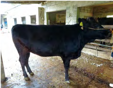
助成事業による優良素牛の頭数確保