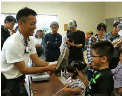
地域おこし協力隊の活動が地域のつながりをつくる

かわりを作りあげつつあります。これら関係人口に該当する人々の専門的知見、人脈、事業展開力を本町の活力とし、移住に関しては、徳之島で生まれ育ち、進学、就職で島外に暮らすUターン希望者に対する動機を特定し、各世代の出身者がそれぞれのライフステージで、島へ帰りたくなる、戻っても安心な暮らしを送れるような施策を打ち出します。