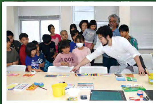
第8回 「アートって何だろう?」