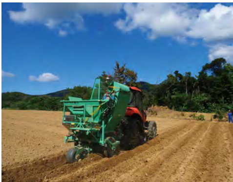
ビレットプランターによる植付作業

従来から実施してきた堆肥セクターの堆肥や緑肥を用いた土づくりの強化にもひきつづき取り組みます。夏植え・改植を奨励するために、夏・春植え新植に対する助成事業を実施し生産拡大に努めるとともに、低反収の要因である干ばつ対策にも重点をおき反収向上に努めてまいります。