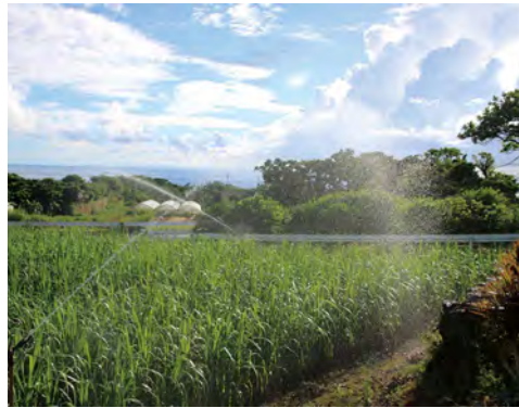
水利用による営農推進

●令和3年度までに完了予定の畑地かんがい事業を更に推進し、農家の反収アップを目指し、徳之島ダムの水を利用した営農の推進及び散水設備の整備を進めてまいります。