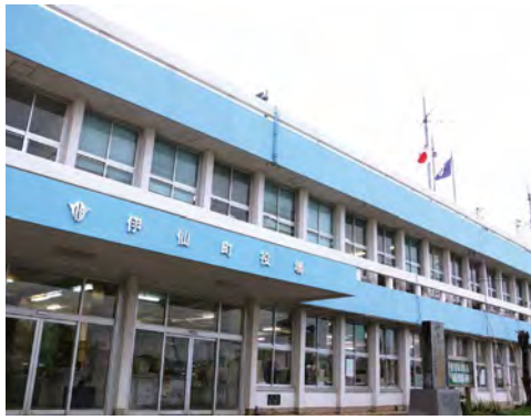
老朽化が進む伊仙町役場庁舎

● 行政手続きのみならず、町民同士の交流を促し、コミュニティ拠点としての役割を担えるよう、談話スペースや多目的スペース等を備えた庁舎とします。