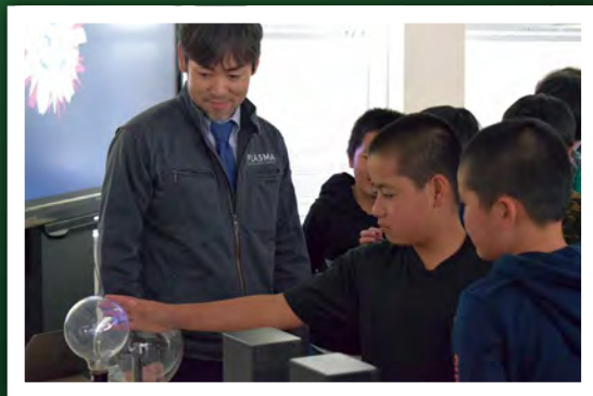
第10回 「“プラズマ”って何だろう?」