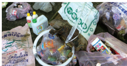
農業用肥料袋(産業廃棄物)、缶やペットボトル(資源ごみ)、蛍光灯