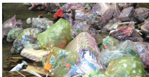
指定袋以外のごみ出しやプラスチック容器(燃えるごみ)