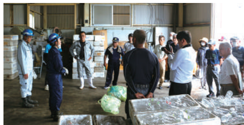
8/11 区長会・商工会による展開検査