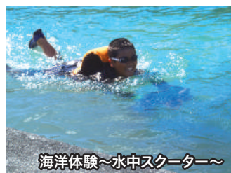
海洋体験～水中スクーター～