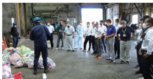
7/28 課長・局長による展開検査

不法投棄やごみの分別などは、一人ひとりが問題を認識し、改善していかなければなりません。正しい分別をしなければクリーンセンターの負担が大きくなり、機械の修理が必要になれば、島民一人ひとりの負担となります。また、缶や瓶、ペットボトルは資源ごみとしてリサイクルすることで財源となり、分別されず処理することで費用がかかります。しっかりと分別することがクリーンセンターの負担軽減だけでなく、島民一人ひとりの負担軽減に繋がります。きゅらまち観光課では今後、家庭から出る生ごみのたい肥化に向けた施策などを計画しております。クリーンセンターの負担軽減や家庭ごみの軽減、また集落環境の美化に繋げるため、今後とも、みなさまのご理解、ご協力をよろしくお願いいたします。