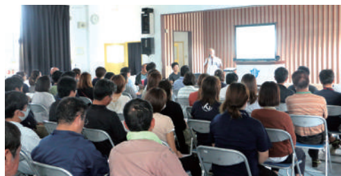
7/31 職員研修(クリーンセンターの現状と課題)