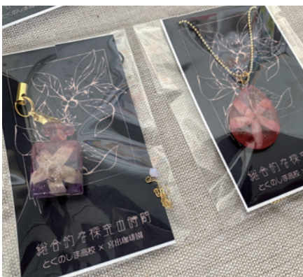
コーヒーの花を使ったアクセサリー