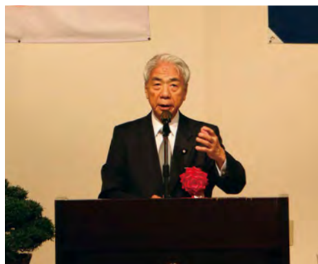
元厚生労働大臣 尾辻 秀久 参議院議員

基調講演1「増え続ける社会保障費から見るこれからの地域」においては、元厚生労働大臣 尾辻参議院議員が登壇し、社会保障費に関する資料を示しながら、「人口減少が進むなかで、社会保障を考えていかなければならない」と話しました。また、内閣府のCCRC(生涯活躍のまち)の地域再生計画制度の対象として、全国自治体の中の21自治体の一つとして、伊仙町が選定を受け