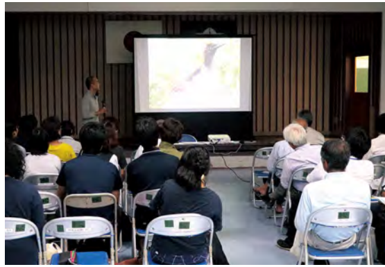
アカヒゲの生態に関するスライド説明