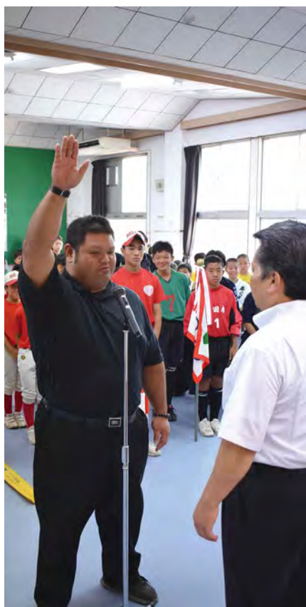
大会への意気込みを込めて選手宣誓