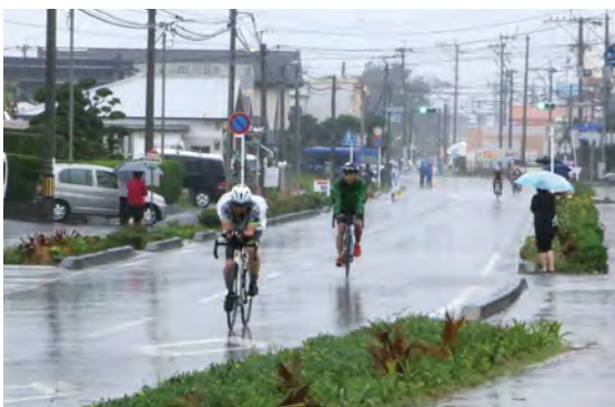
雨の中でも、傘を差しながら応援する光景が見られました