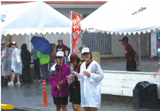
選手の通過を待ちわびる中学生の皆さん