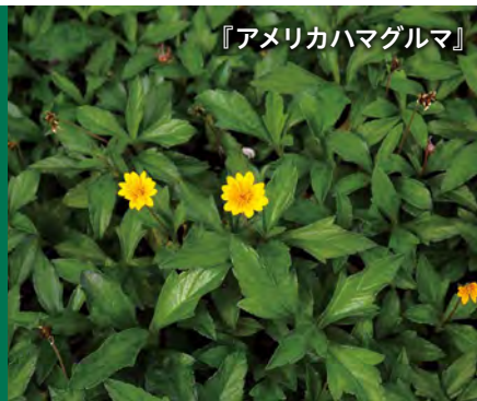
『アメリカハマグルマ』