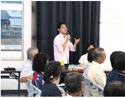
ランに関する質問について、説明を行う講師

講演後には、動植物の生態についての質問や今後の保全についての意見交換がありました。参加者からは「徳之島にこれだけ多くの希少な動植物がいることにびっくりした」「自分の知らないことが多くてすごく勉強になった。今後も色々な講演会に足を運びたい」との感想が聞かれました。