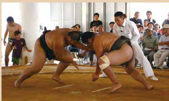
低い姿勢で頭からぶつかり合う高校生の取り組み