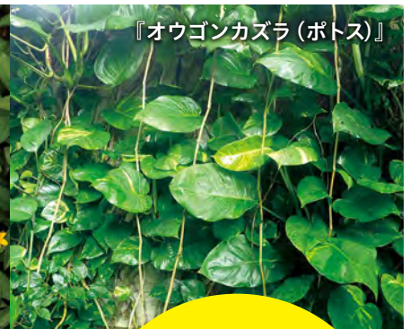
『オウゴンカズラ(ポトス)』