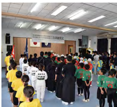
大会に向けて、結束する選手団

伊仙町中央公民館で、第73回県民体育大会、第60回大島地区大会並びに第46回大島地区スポーツ少年団競技別交歓大会の合同結団式が開催されました。各種目に出場する選手の皆さんが集まり、総勢19団体が合同結団式に参加しました。奄美群島内の12市町村から出場する選手たちによって、熱戦が繰り