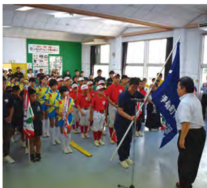
体育協会長から選手団へ体協旗が手渡されました

伊仙町中央公民館で、第73回県民体育大会、第60回大島地区大会並びに第46回大島地区スポーツ少年団競技別交歓大会の合同結団式が開催されました。各種目に出場する選手の皆さんが集まり、総勢19団体が合同結団式に参加しました。奄美群島内の12市町村から出場する選手たちによって、熱戦が繰り