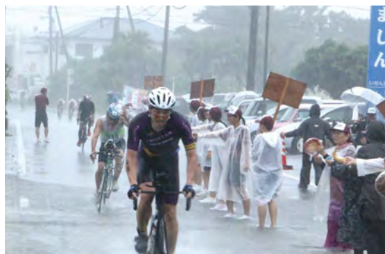
続々とエイドステーションを通過する選手たち