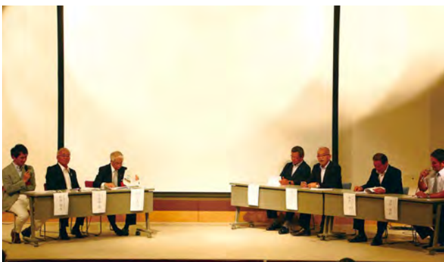
パネルディスカッションでは、徳之島の課題や今後の取り組みについて意見交換

パネルディスカッションでは、当日来場者から回収したアンケートに書かれた意見や課題が取り上げられ、「健康づくり」「独居問題」「小児科医の充実」などについて意見交換がありました。独居問題については「都会では独居が多すぎて難しい面もあるが、徳之島の素晴らしいところは、地域で見守る環境があること」