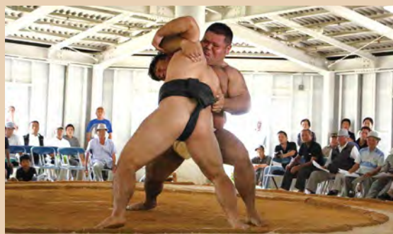
持ち前のパワーを生かし豪快に寄り切る中選手