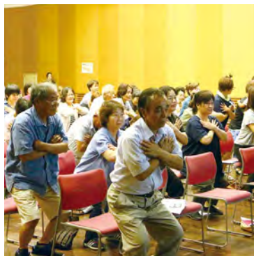
椅子を使ってできる筋力トレーニング