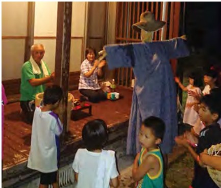
訪れた子どもたちを迎えます

昔から脈々と受け継がれてきたイツサンサン。保護者の皆さんも一緒に回りながら、子どもの頃に参加していたことを懐かしく思い出していたようです。夏休み最後の思い出として、参加した子どもたちの記憶にも刻まれたことでしょう。