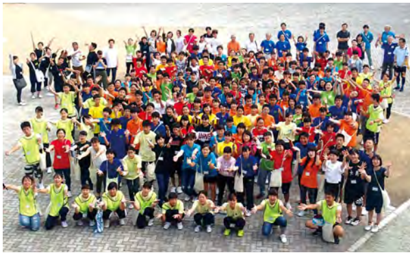
研修会終了後、全体写真

中心に、グループで活動・行動をして3日間の研修会を過ごしました。各県の出し物発表では、「鹿児島県(当地クイズ)」を行い、大いに盛り上がりました。