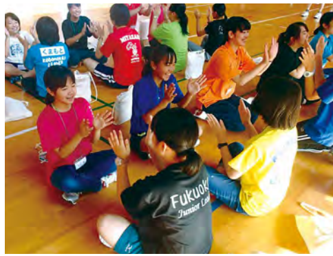
レクリエーション『手遊び』