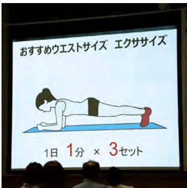
腰回りの筋肉を鍛えることで、腰痛防止につながります

食事のとり方や効果的な運動について、紹介がありました。後半の部では、ウエストサイズ大作戦開講式が行われました。健康づくりをしながら、上位者には豪華特典が手に入るなどお得な企画です。健康支援アプリを利用して、歩数を確認したり、ポイントの確認もできます。参加者の皆さんには、結果発表まで楽しみながら、健康づくりに取り組んでほしいと思います。