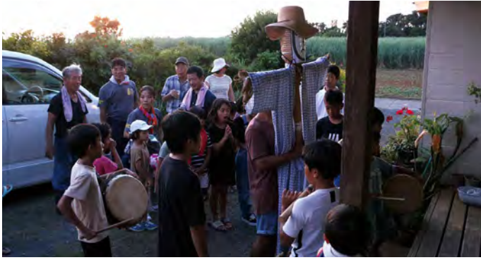
主役のイツサン棒を持って、家々を回ります

日が落ち始めた午後6時頃から、子どもたちがイツサン棒とテイルをぶら下げ、集落の家々を回ります。家では、お餅(カシヤムチ)やお菓子などが準備されていました。玄関先や縁側で歌を唄う子どもたち。この日を楽しみにしている高齢者の皆さん。子どもたちも歌を唄いながら、みんなで楽しんでいました。