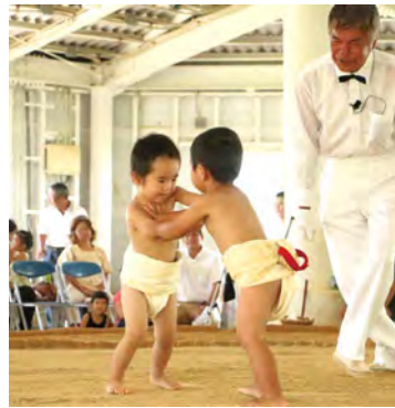
なかなか勝負がつきません