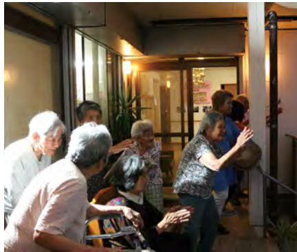
高齢者の皆さんも楽しみにしています