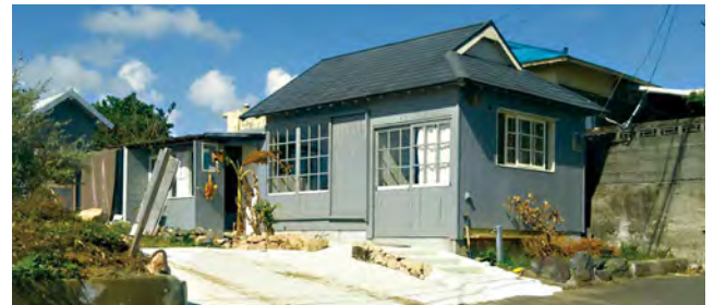
コーヒーの木研究室