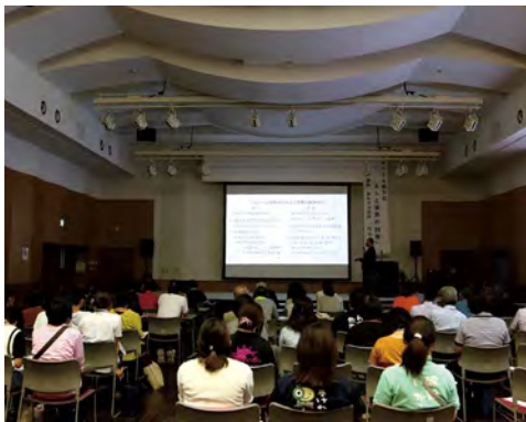
約30名の関係者が参加しました