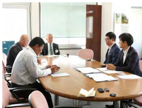
暮らしの便利帳について意見交換

立てれば」と今後の展望について、抱負を語りました。暮らしの便利帳は全国で約900の自治体で発行されており、奄美群島内では3例目となります。