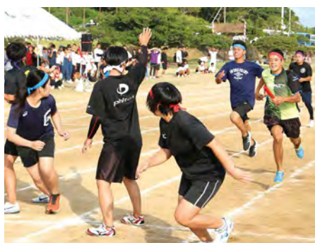
⑮ 高校生対抗リレー