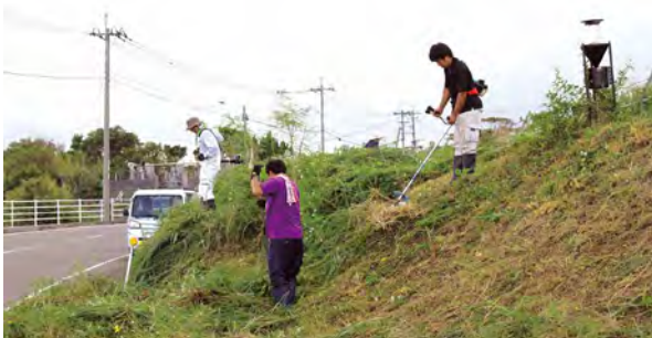
義名山近くの伊仙池 除草作業