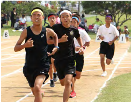
⑦ 1500メートル走 (中学生男子)