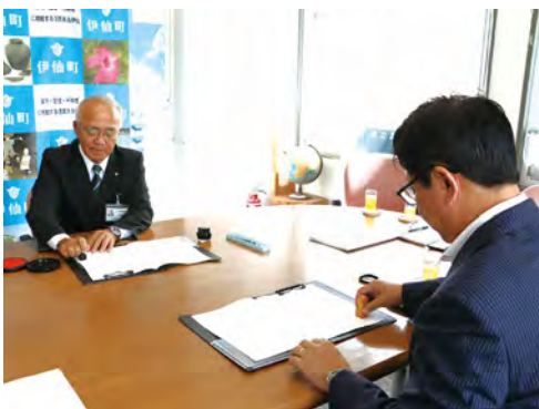
共同発行に関する協定書に双方でサイン