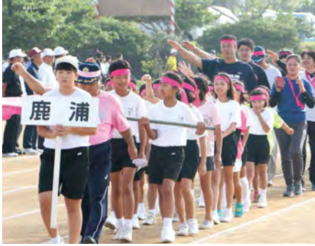
① 8校区選手団による入場行進