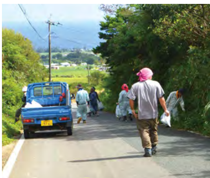
道路脇に捨てられた空き缶などを回収

また、参加者からは「車で通るとゴミが落ちてるのが分らないが、歩いてみるとゴミの多さにびっくりした。未来の子どもたちの為にも、ゴミのポイ捨てはやめてほしい」と「またこのようにイベントが開催される時は、ぜひ参加したい」などの感想が聞かれました。