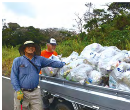
軽トラックに満載された回収ゴミ