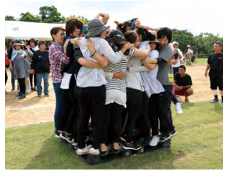
⑨ 何人乗れるかを競う 夢舞台