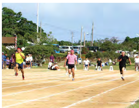
⑩ ハイレベルなメンバーが揃った100メートル走 (50歳以上男子)