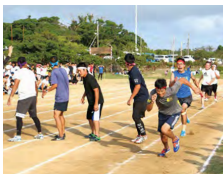
⑯ 最終種目 男子400メートルリレー