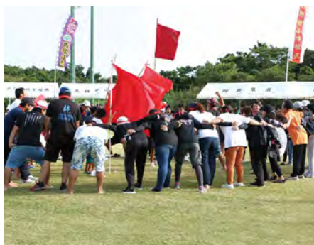
⑪ 綱引き決勝戦を前に円陣を組む犬田布校区