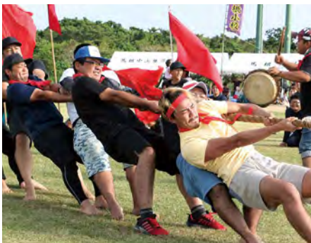
⑫ 綱引き決勝戦 犬田布校区