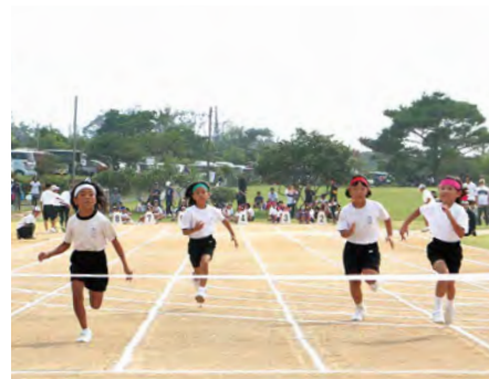
⑥ 100メートル走 (小学生女子)