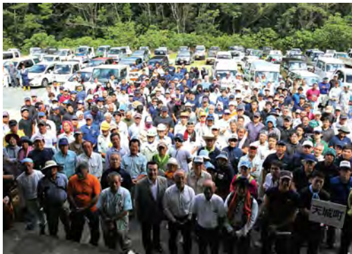
参加したボランティアの皆さん

関係者からは「当初の計画ではこのような規模の清掃会は想定していなかった。計画を進めていくなかで賛同者が増え、このような大規模な清掃会を開催することになった。世界自然遺産登録に向けての島民の機運が醸成されていることを感じ、とてもうれしい」との声が聞かれました。