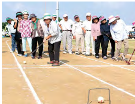
⑤ ゲートボールリレー