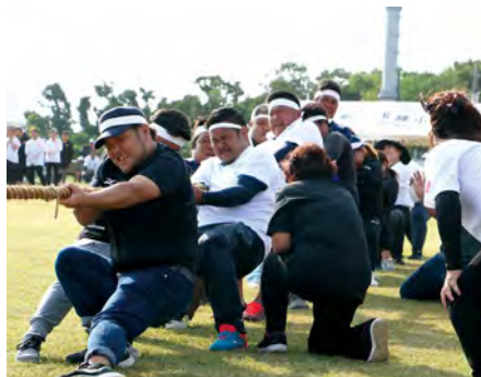
⑬ 綱引き決勝戦 面縄校区