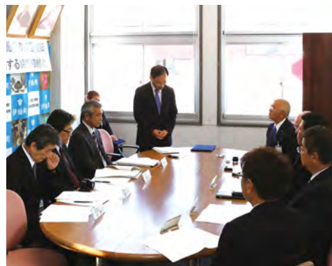
災害時の復旧支援体制について説明を受ける

て、漁港施設が大きな被害を受けましたが、今回の協定締結によって、災害の発生から災害査定までの一連の業務の速やかな対応が可能となります。