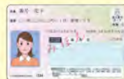
現在お持ちの マイナンバーカード