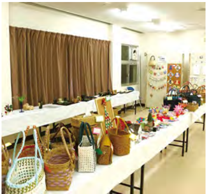
受講生の創作品が展示されていました

島料理について学ぶことができ、非常に参考になりました。タイでも、パイヤを使いますが、徳之島のパイヤは特に美味しいです」と話しました。舞台発表も行われ、英会話講座の受講生が、英語劇を発表しました。良か余暇講座の皆さんは、三味線に合わせて、島唄を唄い、最後は六調・ワイド節で会場を盛り上げました。