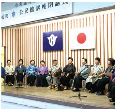
よか余暇講座の皆さんで島唄を披露

島料理について学ぶことができ、非常に参考になりました。タイでも、パイヤを使いますが、徳之島のパイヤは特に美味しいです」と話しました。舞台発表も行われ、英会話講座の受講生が、英語劇を発表しました。良か余暇講座の皆さんは、三味線に合わせて、島唄を唄い、最後は六調・ワイド節で会場を盛り上げました。