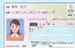
本人の マイナンバーカード