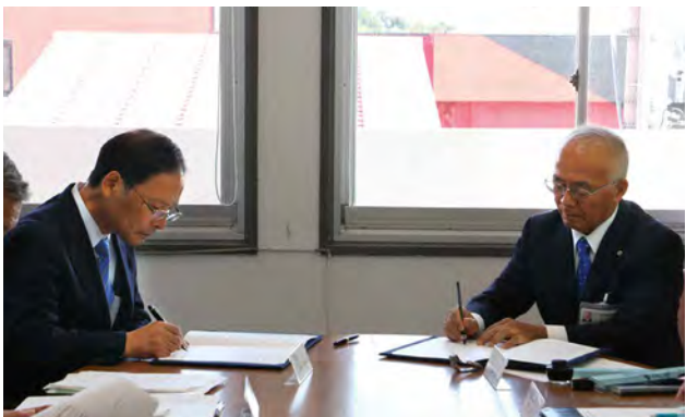
協定書にサインをおこなう様子

一般社団法人水産土木建設技術センターは、水産関係土木施設に関する専門的な技術や業務の蓄積があります。東日本大震災発生時に東北地方の漁港施設が大きな被害を受けましたが、復旧に50名程度の技術者を現地に派遣し、復興を支援してきました。