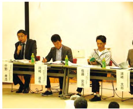
パネリストによる意見交換

氏は「女性や高齢者、障がい者の目線で見ると生活が大事で、女性が幸せであると生活がしやすい」と広い視野で捉えていくことの重要性を述べました。