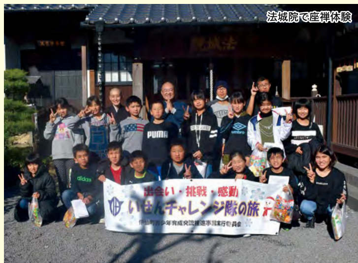
法城院で座禅体験

住み慣れた伊仙町を離れ、18名の参加者と共に過ごした4日間は、子ども達にとって新しい出会いと発見がありました。事前研修からチャレンジ隊の旅での研修を重ね、お互いの絆を強めることができました。