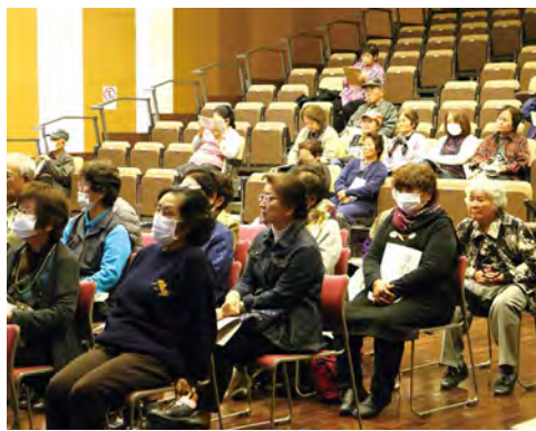
講演会に訪れた皆さん