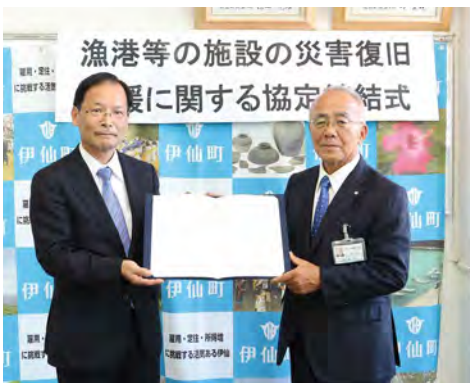
調印式後（大久保町長（右）、宇賀神理事長（左））