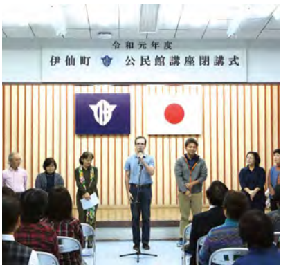
公民館講座で講師を務めた皆さん