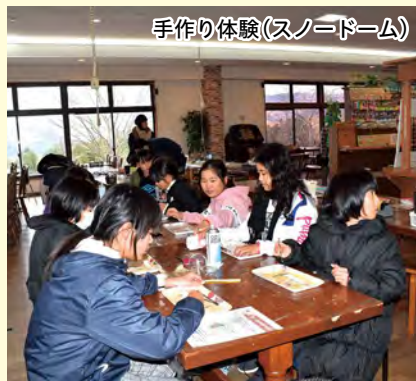
手作り体験(スノードーム)

初めての共同生活でしたが、子ども達は事前研修を受け互いの連携がとれていたため、研修中の活動も相談・協力をしながら積極的に取り組むことができました。