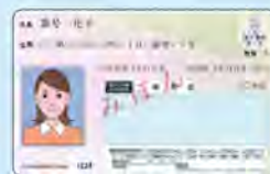
代理人の本人確認書類 〔マイナンバーカードや 運転免許証等〕