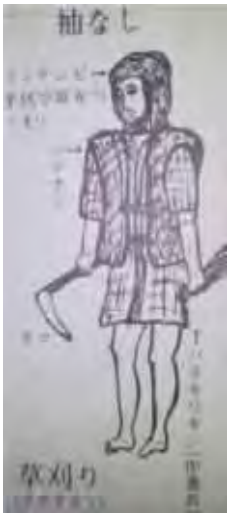
図1 作業衣 (伊仙町誌457pより引用)

私たちの祖父母の時代は、子供や家族に対してどのような着物が何枚必要なのかを考え、少しでも美しいものを着せてあげたいと、組み合わせや技法を工夫していったのだと思います。