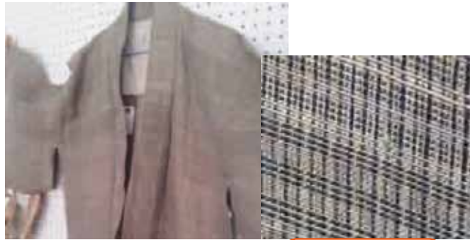
↑写真1 伊仙町歴史民俗資料館 所有のバシヤギンその1

伊仙町歴史民俗資料館には、現在数十点のバシヤギンの収蔵があり、その内の2点の展示を行っています。写真1と2のバシヤギンに関する詳細はわかっていますが、たて糸は藍で染められた芭蕉を使用し、よこ糸は染めていない芭蕉を使用しているものと思われま