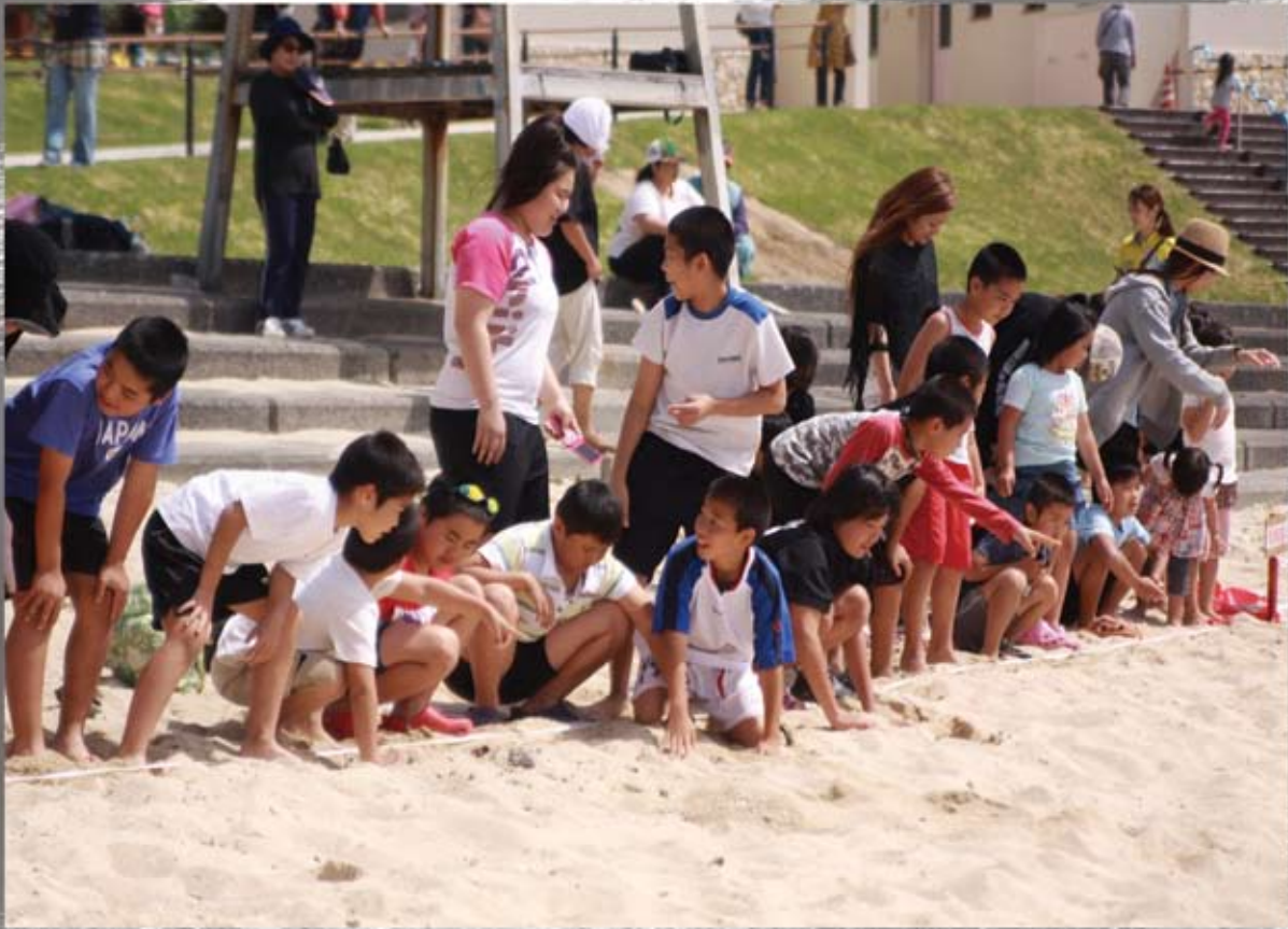
砂の中に宝が… (待ちきれない様子の子どもたち)