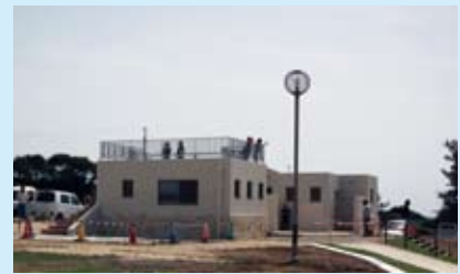
新しくトイレ・シャワー室が完備