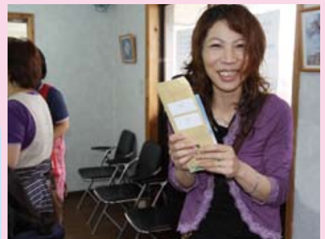
子ども手当を支給され喜び保護者(第1号受給者)