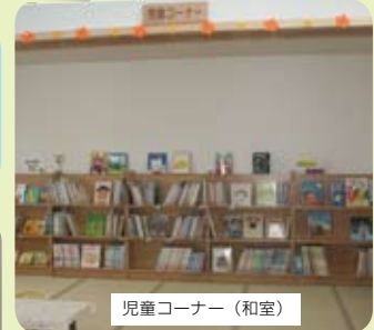
児童コーナー(和室)