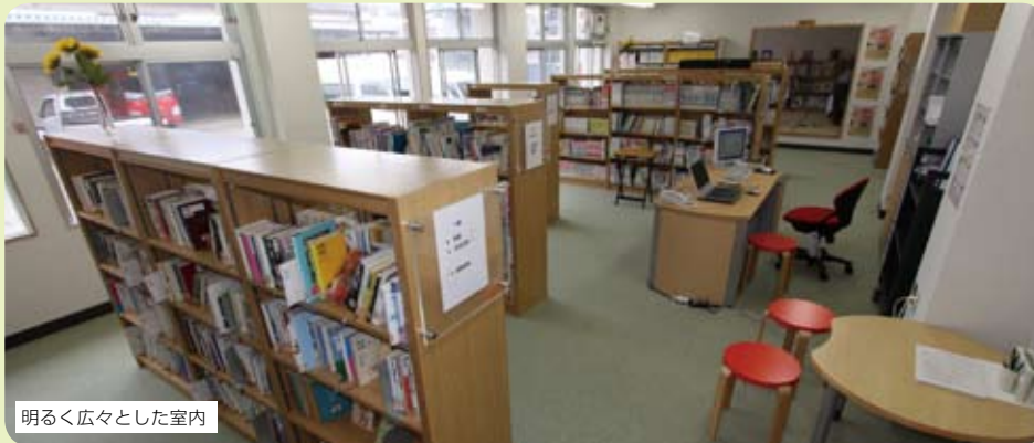
明るく広々とした室内