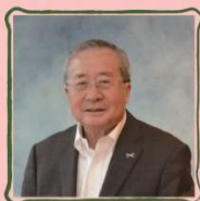
おがさわら たくしげ 尾形 武寿

(公財)日本財団会長、日本船用機械輸出振興会ロツテルダム事務所所長として勤務後、一九八〇年に日本船舶振興会(現日本財団)入会。二〇二五年から会長を務める。