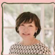
あべ あきえ 安倍 昭恵

(公財)日本財団会長、日本船用機械輸出振興会ロツテルダム事務所所長として勤務後、一九八〇年に日本船舶振興会(現日本財団)入会。二〇二五年から会長を務める。